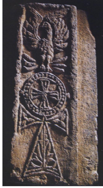
شكل (٥) نحت جنازي غير معلوم المصدر القرن السادس الميلادي - المتحف القبطي بالقاهرة