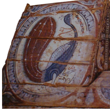
تفصيلية من شكل (١) توضح شكل الطاووس

تابوت مزين بطواويس - مصر من العصر البيزنطي - خشب مطلي هايدلبرج - متحف المصريات بالجامعة