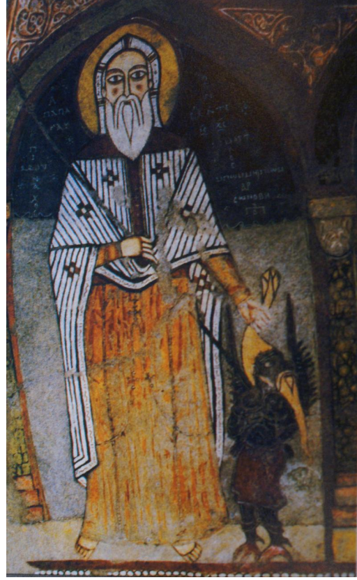
تفصيلية من شكل (٢٩)

القديس أبا كاف - تصوير جداري من الكنيسة الأثرية - القرن الثالث عشر الميلادي دير الأنبا انطونيوس - البحر الأحمر