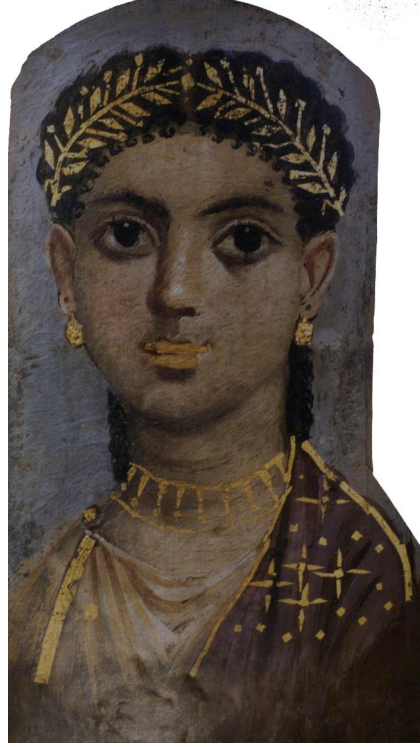
شكل (١٩) وجه لشابه صغيرة من القرن الثاني الميلادي - متحف كليفلاند للفنون - أوهايو - الولايات المتحدة الامريكية