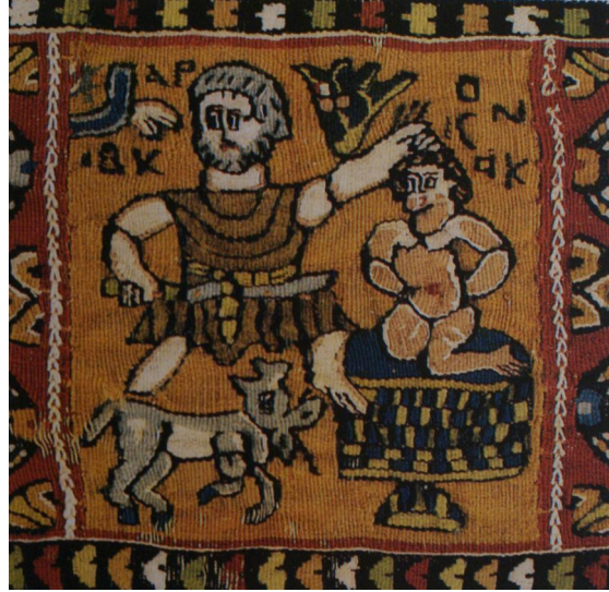
شكل (٢٠) نسيج يمثل تضحية ابراهيم من الكتان والصوف - القرن الثالث الميلادي متحف المنسوجات - ليون فرنسا