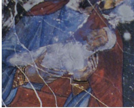
تفصيلية من شكل ١٦

تصوير جداري داخل نصف قبة بالجدار الشمالي بالخورس - يمثل نياحه السيدة العذراء - الكنيسة الأثرية - القرن الثالث الميلادي دير السريان - وادي النطرون