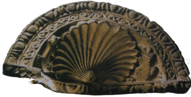
شكل (٦) قمة كوة مزدانة بصدفة عثر عليها في مدينة أهناسيا - حجر كلسي القرن الثاني إلى الرابع الميلادي المتحف القبطي بالقاهرة